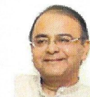
Shri Arun Jaitley Minister of Finance, Corporate Affairs and I&B