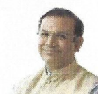
Shri Jayant Sinha MOS for Finance