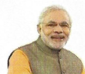
Shri Narendra Modi Prime Minister